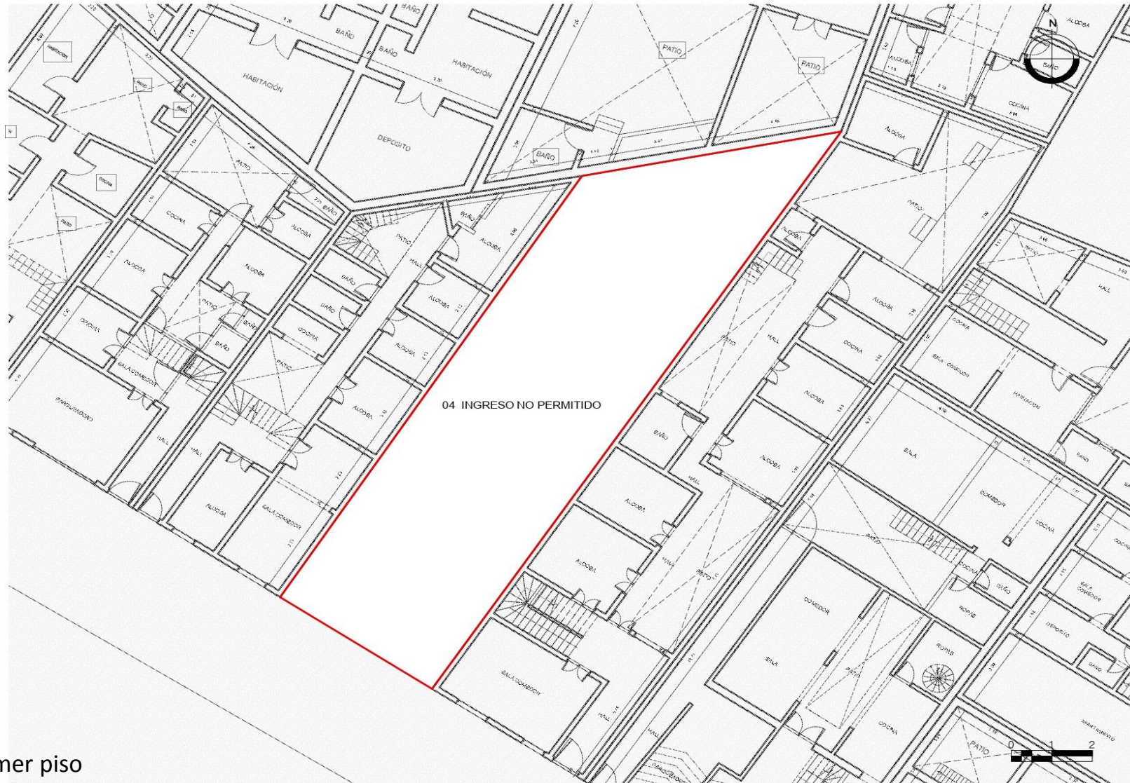
Planta primer piso